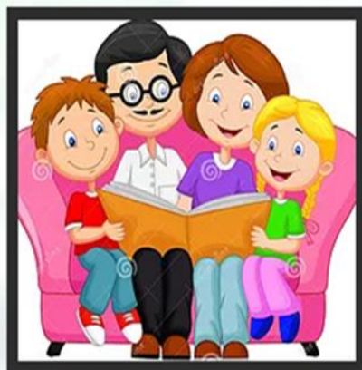
"Читаем всей семьёй"