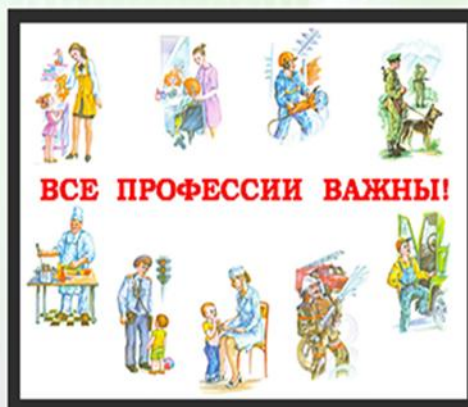
Профессии в моей семье