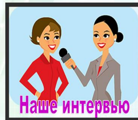
Интервью с членами семьи